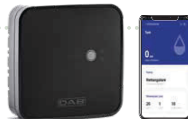
DCONNECT BOX 2

DTron 3 es, de esta manera, la primera bomba sumergible con pantalla.